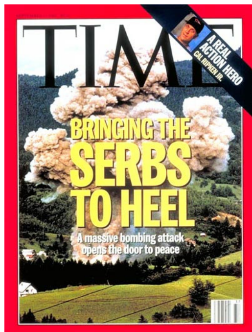
Figura 5: Otra portada de la revista “Time” en la que vincula el bombardeo a los serbios con la llegada de la paz.

Pero no se trata solo de la opinión de meros investigadores. El propio general belga François Briquemont, jefe de los cascos azules en Bosnia-Herzegovina en 1994, llegó a reconocer que 16 :