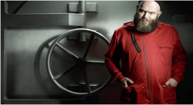
Figura 7: Helsinki forma parte del grupo que atraca la Fábrica Nacional de Moneda y Timbre en la Casa de Papel.