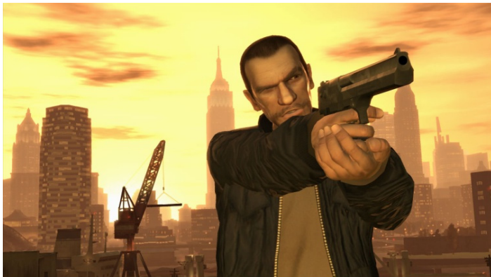
Figura 8: Niko Belic es el criminal que protagoniza “ Grand Theft Auto IV ”.