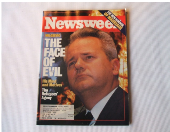
Figura 2: Slobodan Milosevic es “la cara del mal” según la portada de “Newsweek” de abril de 1999.

Ni que decir tiene que nuestra intención no es caer en ese maniqueísmo ni en esa simplificación que denunciarnos. Por supuesto que en el bando serbio se cometieron crímenes horribles que condenamos. No negamos que muchos de los hechos que cimentaron el relato fueran reales: criticamos su manipulación para imponer un relato culpabilizador que responde más al pensamiento mágico que al científico. Y es que, más que un relato, las Guerras Yugoslavas se han convertido en un auténtico mito fundacional (el de las distintas repúblicas) en el cual, a su vez, tienen cabida otras historias legendarias y religiosas como la de David contra Goliat 8 . Bronislaw Malinowski explica lo siguiente en “Estudio de psicología primitiva” 9 :