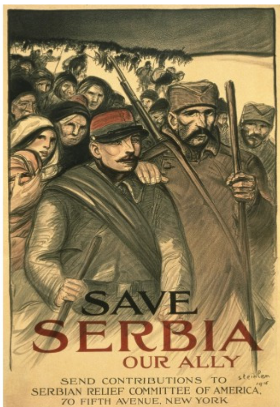
Figura 3: Cartel estadounidense para recaudar fondos para los soldados serbios durante la I Guerra Mundial (1914).

Al contrario que en el caso de Rusia, el resto de ramas de la industria cultural apenas ha elegido Serbia como marco para sus contenidos. Esta falta de atención se debe en gran medida a que no constituye una amenaza creíble para occidente en comparación con otros estados de mayor potencial militar y en comparación con peligros reales para la seguridad, como el terrorismo o el narcotráfico. El posicionamiento unánime y diáfano por parte de los Gobiernos y los medios de comunicación de Europa y América del Norte contra la República Federal de Yugoslavia (RFY) y las minorías serbias en los sucesivos conflictos bélicos fue configurando el relato y estereotipo dominante en la opinión pública. Josep Palau 12 opina al respecto: